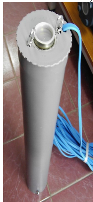
КОЖУХ ЗА ОХЛАЖДАНЕ НА ДВИГАТЕЛ ПОТОПЯЕМА СОНДАЖНА ПОМПА ПРИ ДИАМЕТЪР НА ВОДОИЗТОЧНИКА > ф 150 мм